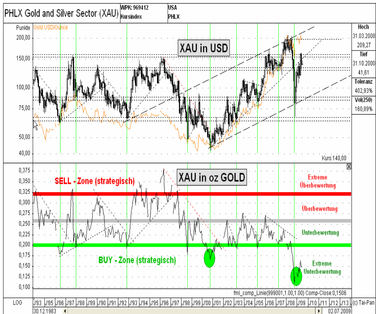
Abb. 4: XAU-Goldminen-Index in USD (oben) vs. XAU in Unzen GOLD (unten) von 1984 bis heute

Aufgrund der weiterhin extrem fundamentalen Unterbewertung der Goldminen, in Bezug auf ihren Umsatzfaktor Goldpreis (siehe hierzu Abb. 4), braucht man nicht all zuviel Phantasie, um sich die mittelfristige Entwicklung dieses Sektors vorstellen zu können. Der Hebel der Goldminenentwicklung auf den Goldpreis liegt durchschnittlich im Bereich zwischen 2 und 4. Dieser Leverage funktioniert nach oben als auch nach unten, wie uns im letzten Jahr „eindrucksvoll“ demonstriert wurde. Somit dürfte eine Goldminen-Renditeerwartung von über 100 Prozent (!) für den kommenden mittelfristigen Impuls nicht übertrieben klingen. Hierbei unterstellen wir nur eine, im historischen Kontext betrachtete, „Normalbewertung“ und keine extreme Überbewertung der Goldminen, die meist am Ende eines Zyklus auftritt. Unabhängig von der einen oder anderen noch kurzfristigen Irritation („Sommerschwankung“), erwarten wir mittel- und langfristig eine sehr positive Entwicklung für den Goldsektor.