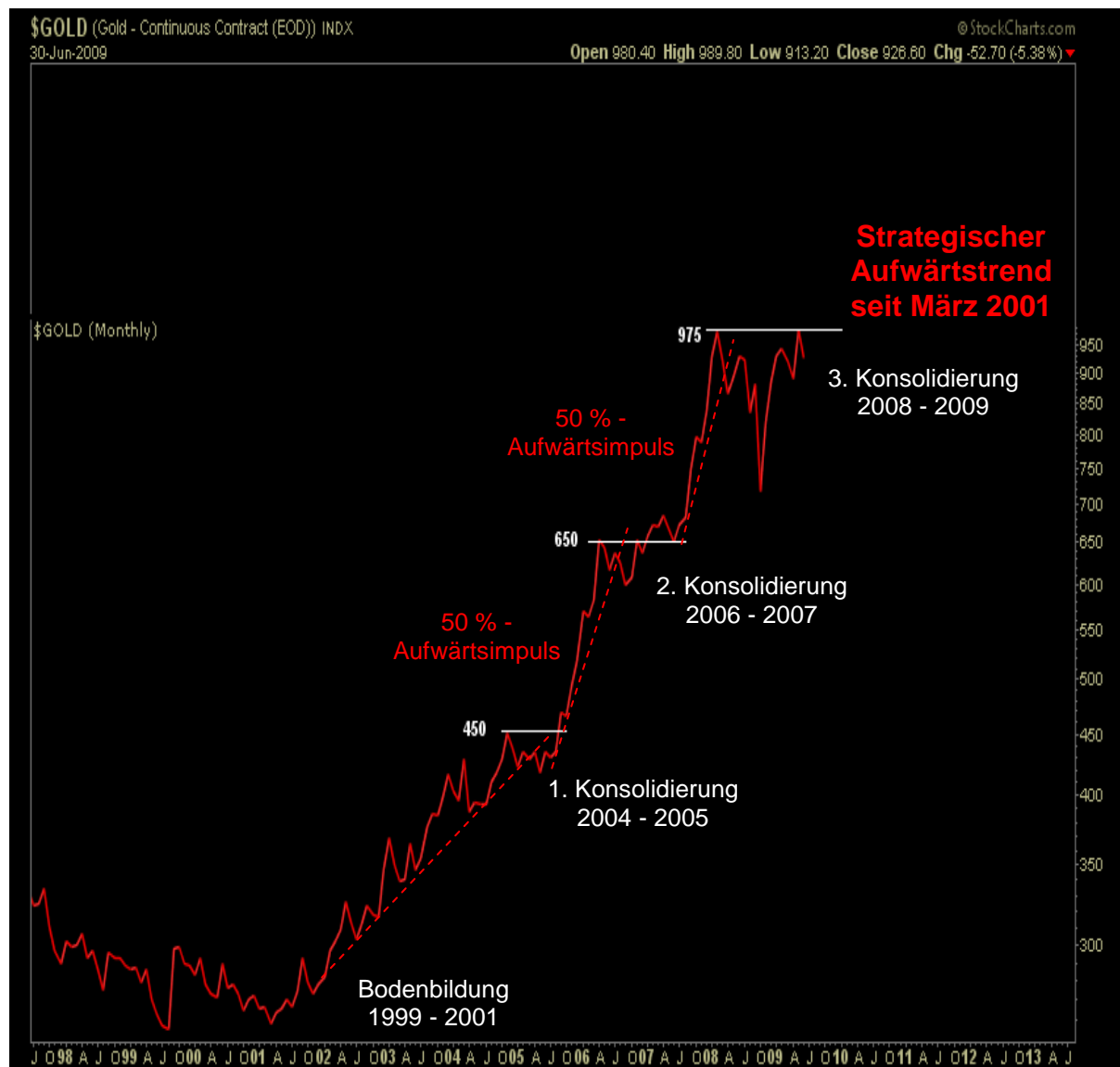
Abb. 3: Goldpreis in USD auf Monatsschlusskursbasis von 1998 bis heute