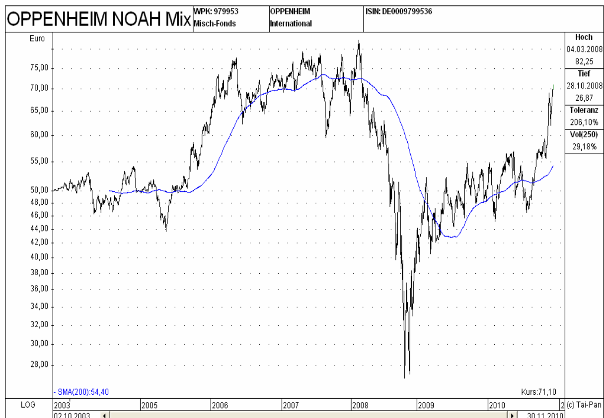
Abb. 1: Kursentwicklung des NOAH-Mix OP (979 953) von 01.10.2003 bis 30.11.2010

Das Sondervermögen NOAH-Mix OP weist aufgrund seiner Zusammensetzung eine erhöhte Volatilität auf, d.h. die Anteilspreise können auch innerhalb kurzer Zeiträume erheblichen Schwankungen nach oben und nach unten unterworfen sein. Zu den Risiken zählen insbesondere Adressausfall-, Zinsänderungs-, Währungs- sowie sonstige Marktpreisrisiken, operationelle Risiken und Liquiditätsrisiken.