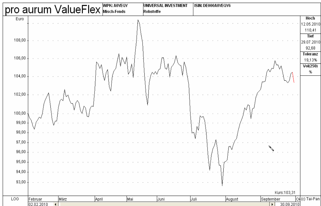
Abb. 1: Kursentwicklung des pro aurum ValueFlex (A0YEQY) von 01.02.2010 bis 30.09.2010

Das Sondervermögen pro aurum ValueFlex weist aufgrund seiner Zusammensetzung eine erhöhte Volatilität auf, d.h. die Anteilspreise können auch innerhalb kurzer Zeiträume erheblichen Schwankungen nach oben und nach unten unterworfen sein. Zu den Risiken zählen insbesondere Adressausfall-, Zinsänderungs-, Währungs- sowie sonstige Marktpreisrisiken, operationelle Risiken und Liquiditätsrisiken.