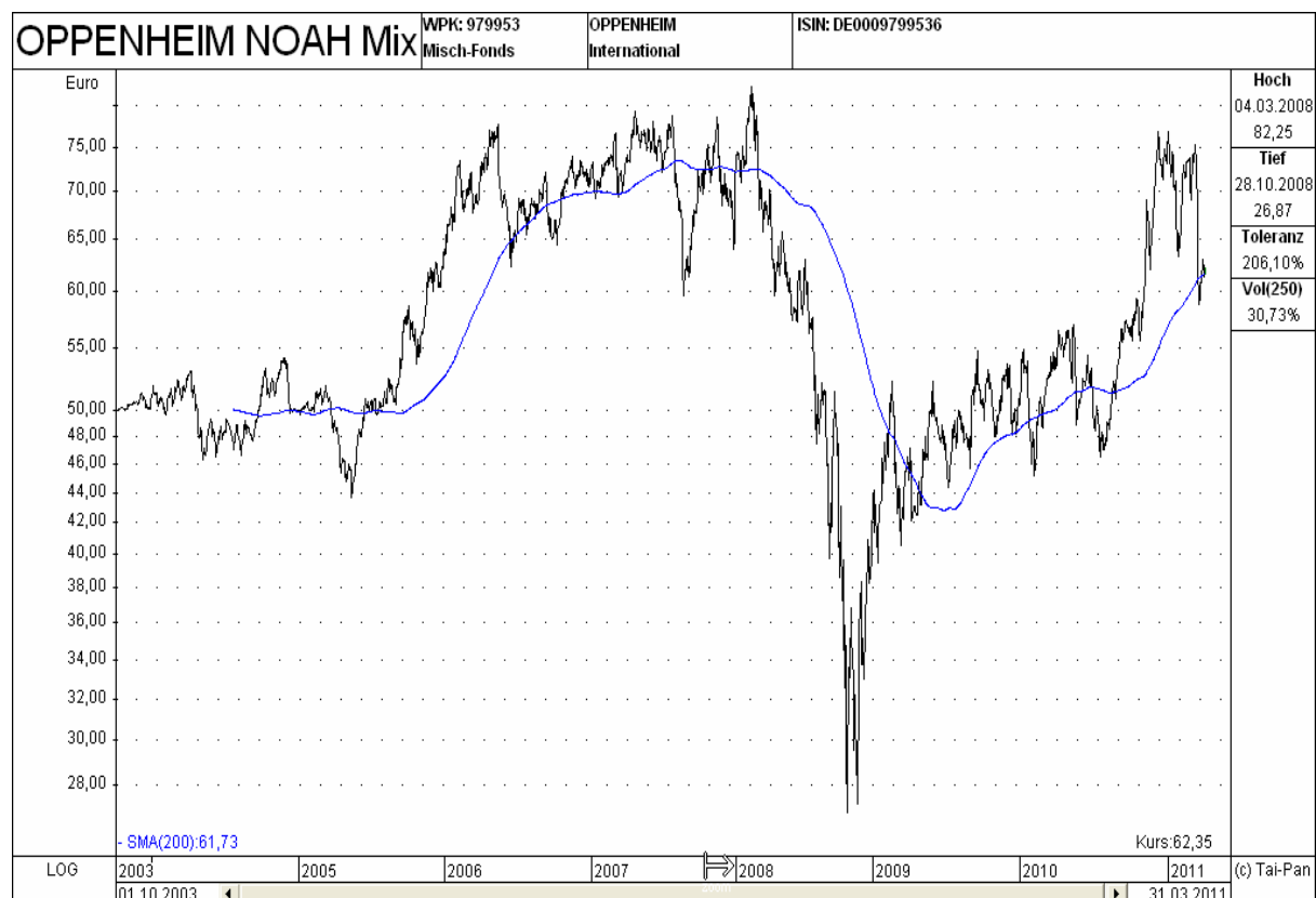
Abb. 1: Kursentwicklung des NOAH-Mix OP (979 953) von 01.10.2003 bis 31.03.2011

Das Sondervermögen NOAH-Mix OP weist aufgrund seiner Zusammensetzung eine erhöhte Volatilität auf, d.h. die Anteilspreise können auch innerhalb kurzer Zeiträume erheblichen Schwankungen nach oben und nach unten unterworfen sein. Zu den Risiken zählen insbesondere Adressausfall-, Zinsänderungs-, Währungs- sowie sonstige Marktpreisrisiken, operationelle Risiken und Liquiditätsrisiken.