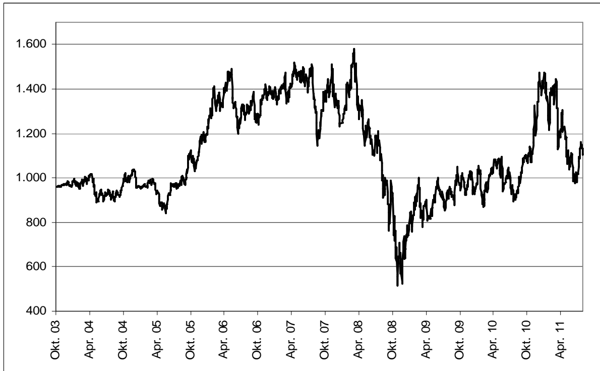
Abb. 1: Wertentwicklung unter Einbeziehung aller fondsinternen Kosten sowie des Ausgabeaufschlages bei Erstanlage. Individuelle Kosten wie Depotgebühren sind nicht berücksichtigt. Unter Einbeziehung dieser Kosten würde die Wertentwicklung niedriger ausfallen. Berechnet gemäß Bundesverband Investment und Asset Management e.V. (BVI).