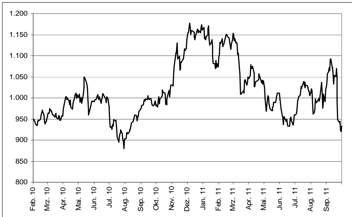
Abb. 1: Wertentwicklung unter Einbeziehung aller fondsinternen Kosten sowie des Ausgabeaufschlages bei Erstanlage. Individuelle Kosten wie Depotgebühren sind nicht berücksichtigt. Unter Einbeziehung dieser Kosten würde die Wertentwicklung niedriger ausfallen. Berechnet gemäß Bundesverband Investment und Asset Management e.V. (BVI).