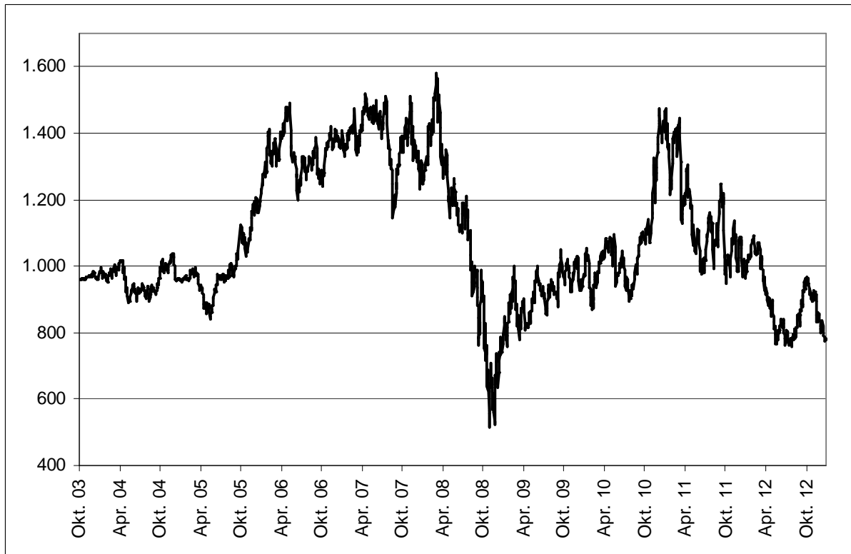
Abb. 1: Wertentwicklung unter Einbeziehung aller fondsinternen Kosten sowie des Ausgabeaufschlages bei Erstanlage. Individuelle Kosten wie Depotgebühren sind nicht berücksichtigt. Unter Einbeziehung dieser Kosten würde die Wertentwicklung niedriger ausfallen. Berechnet gemäß Bundesverband Investment und Asset Management e.V. (BVI).