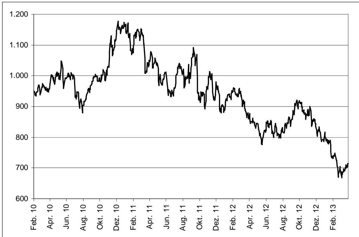
Abb. 1: Wertentwicklung unter Einbeziehung aller fondsinternen Kosten sowie des Ausgabeaufschlages bei Erstanlage. Individuelle Kosten wie Depotgebühren sind nicht berücksichtigt. Unter Einbeziehung dieser Kosten würde die Wertentwicklung niedriger ausfallen. Berechnet gemäß Bundesverband Investment und Asset Management e.V. (BVI).