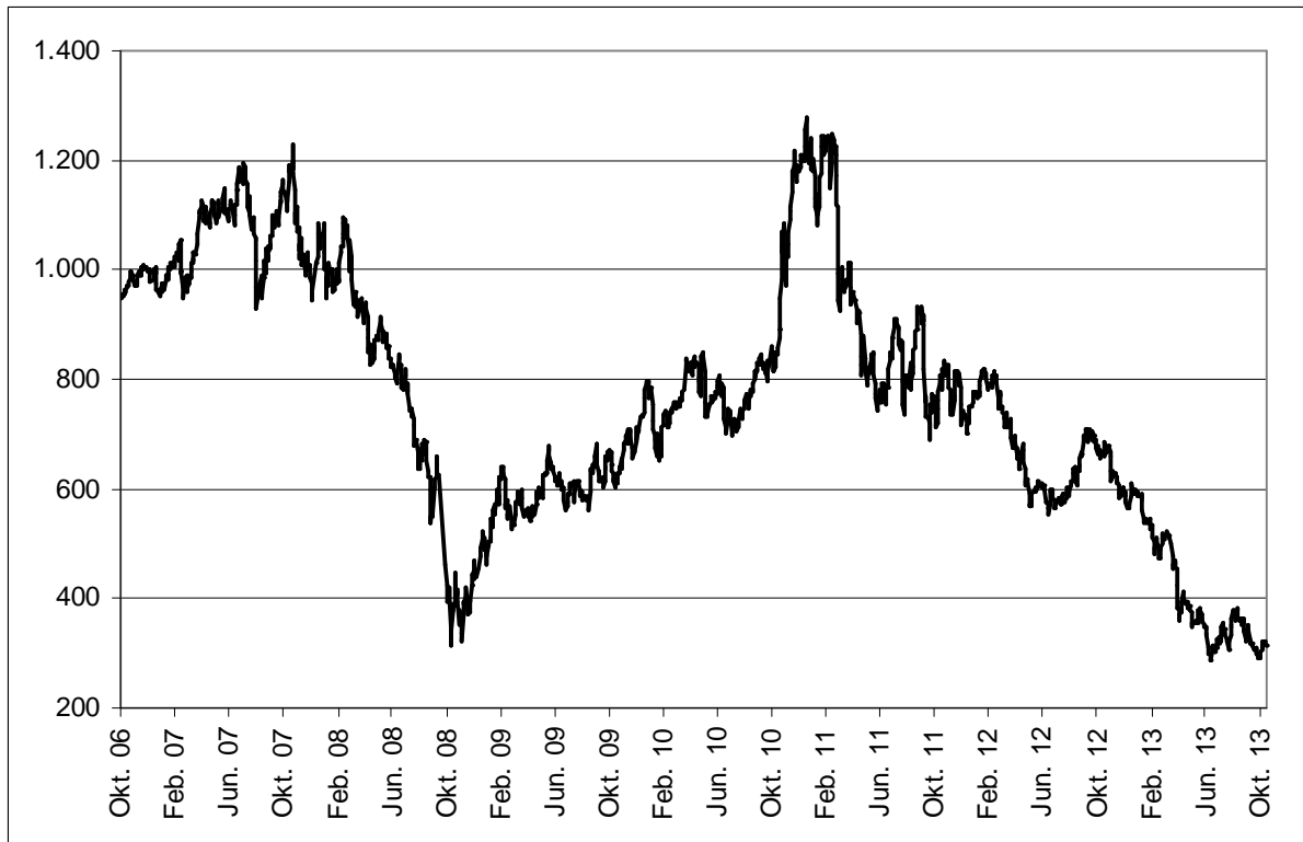
Abb. 1: Wertentwicklung unter Einbeziehung aller fondsinternen Kosten sowie des Ausgabeaufschlages bei Erstanlage. Individuelle Kosten wie Depotgebühren sind nicht berücksichtigt. Unter Einbeziehung dieser Kosten würde die Wertentwicklung niedriger ausfallen. Berechnet gemäß Bundesverband Investment und Asset Management e.V. (BVI).