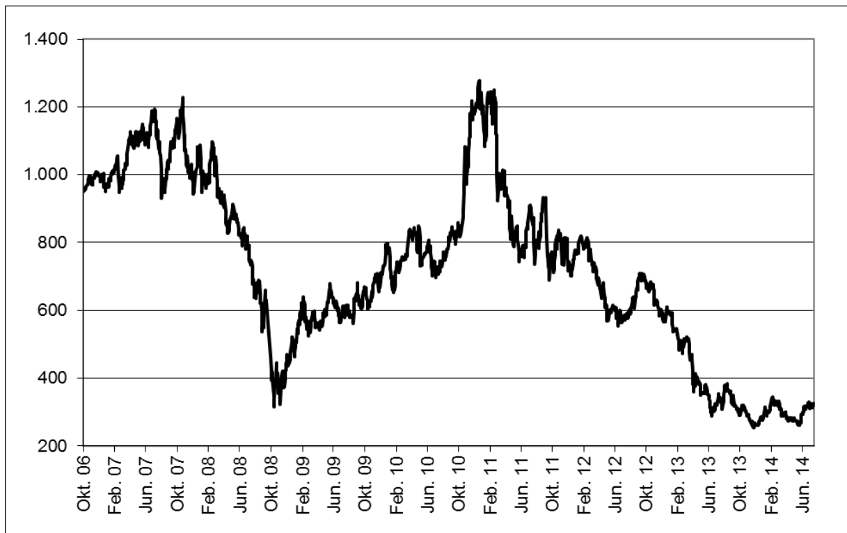
Abb. 1: Wertentwicklung unter Einbeziehung aller fondsinternen Kosten sowie des Ausgabeaufschlages bei Erstanlage. Individuelle Kosten wie Depotgebühren sind nicht berücksichtigt. Unter Einbeziehung dieser Kosten würde die Wertentwicklung niedriger ausfallen. Berechnet gemäß Bundesverband Investment und Asset Management e.V. (BVI).