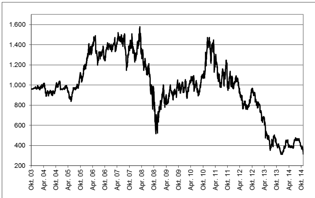
Abb. 1: Wertentwicklung unter Einbeziehung aller fondsinternen Kosten sowie des Ausgabeaufschlages bei Erstanlage. Individuelle Kosten wie Depotgebühren sind nicht berücksichtigt. Unter Einbeziehung dieser Kosten würde die Wertentwicklung niedriger ausfallen. Berechnet gemäß Bundesverband Investment und Asset Management e.V. (BVI).