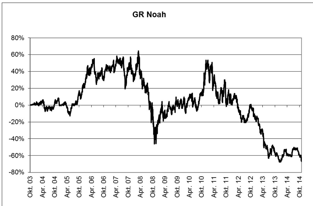
Abb. 2: Die Datenreihe zeigt die Wertentwicklung des GR Noah vom 01.10.2003 bis zum 31.10.2014. Die Wertentwicklung in der Vergangenheit ist kein Indikator für die zukünftige Wertentwicklung und keine Garantie für einen Erfolg in der Zukunft.