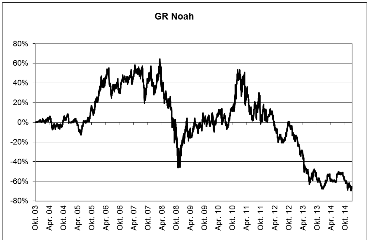
Abb. 2: Die Datenreihe zeigt die Wertentwicklung des GR Noah vom 01.10.2003 bis zum 31.12.2014. Die Wertentwicklung in der Vergangenheit ist kein Indikator für die zukünftige Wertentwicklung und keine Garantie für einen Erfolg in der Zukunft.