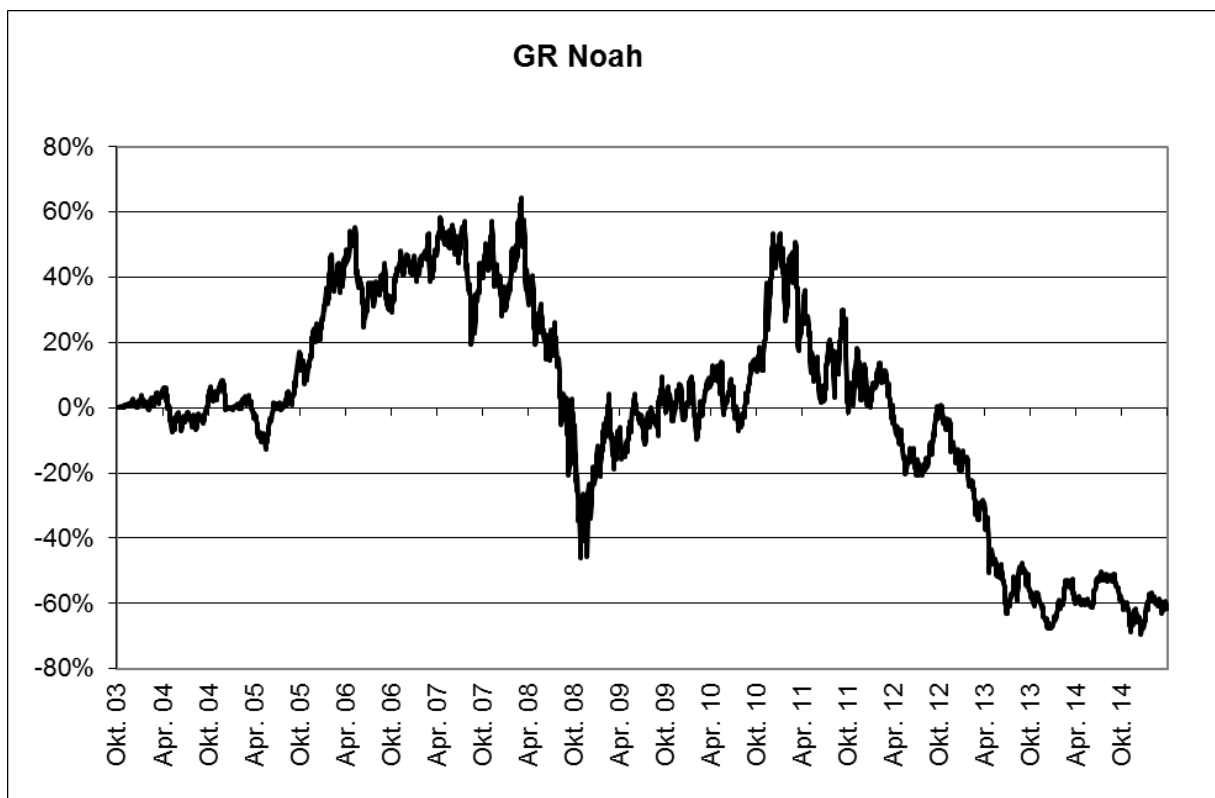
Abb. 2: Die Datenreihe zeigt die Wertentwicklung des GR Noah vom 01.10.2003 bis zum 31.03.2015. Die Wertentwicklung in der Vergangenheit ist kein Indikator für die zukünftige Wertentwicklung und keine Garantie für einen Erfolg in der Zukunft.