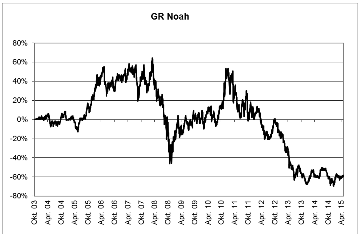
Abb. 2: Die Datenreihe zeigt die Wertentwicklung des GR Noah vom 01.10.2003 bis zum 30.04.2015. Die Wertentwicklung in der Vergangenheit ist kein Indikator für die zukünftige Wertentwicklung und keine Garantie für einen Erfolg in der Zukunft.