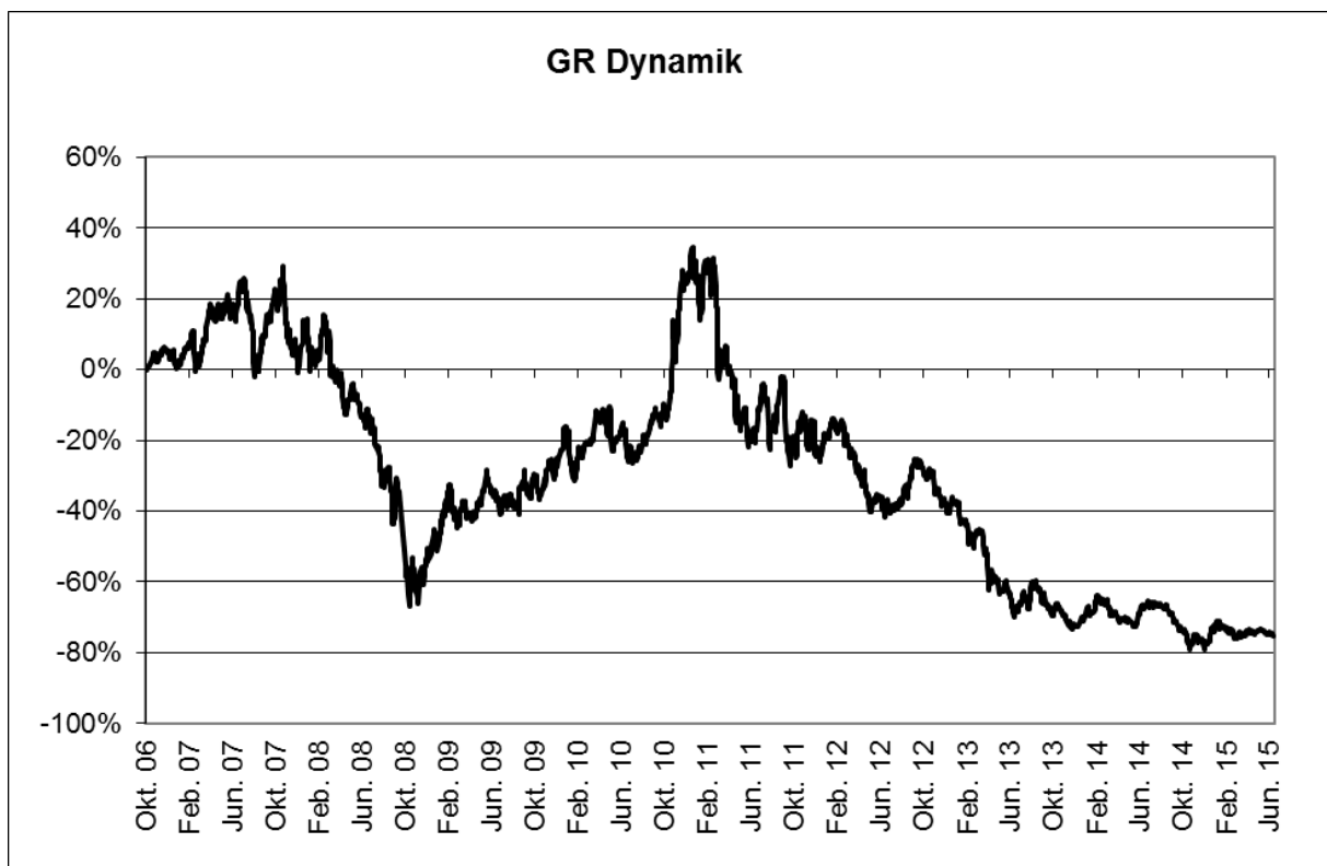
Abb. 2: Die Datenreihe zeigt die Wertentwicklung des GR Dynamik vom 16.10.2006 bis zum 30.06.2015. Die Wertentwicklung in der Vergangenheit ist kein Indikator für die zukünftige Wertentwicklung und keine Garantie für einen Erfolg in der Zukunft.