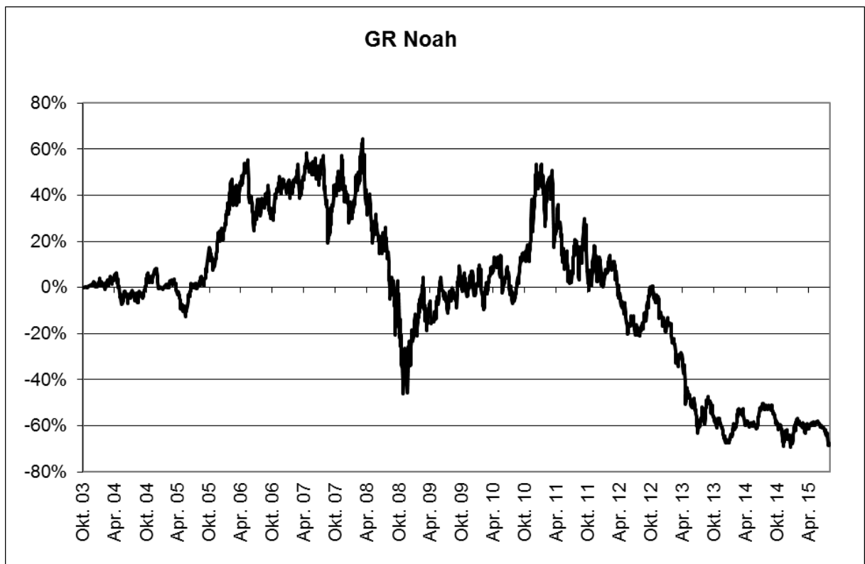
Abb. 2: Die Datenreihe zeigt die Wertentwicklung des GR Noah vom 01.10.2003 bis zum 31.07.2015. Die Wertentwicklung in der Vergangenheit ist kein Indikator für die zukünftige Wertentwicklung und keine Garantie für einen Erfolg in der Zukunft.