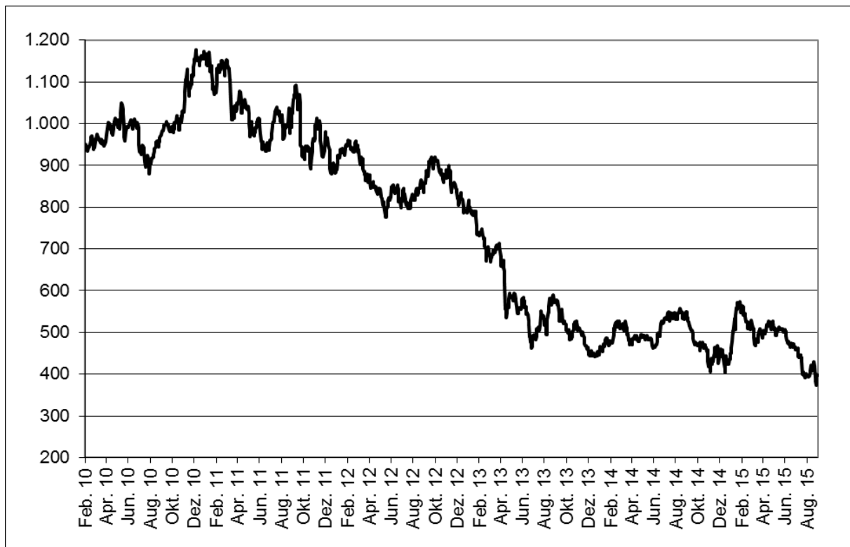
Abb. 1: Wertentwicklung unter Einbeziehung aller fondsinternen Kosten sowie des Ausgabeaufschlages bei Erstanlage. Individuelle Kosten wie Depotgebühren sind nicht berücksichtigt. Unter Einbeziehung dieser Kosten würde die Wertentwicklung niedriger ausfallen. Berechnet gemäß Bundesverband Investment und Asset Management e.V. (BVI).