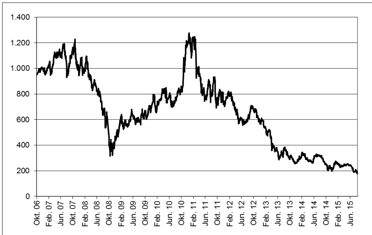
Abb. 1: Wertentwicklung unter Einbeziehung aller fondsinternen Kosten sowie des Ausgabeaufschlages bei Erstanlage. Individuelle Kosten wie Depotgebühren sind nicht berücksichtigt. Unter Einbeziehung dieser Kosten würde die Wertentwicklung niedriger ausfallen. Berechnet gemäß Bundesverband Investment und Asset Management e.V. (BVI).