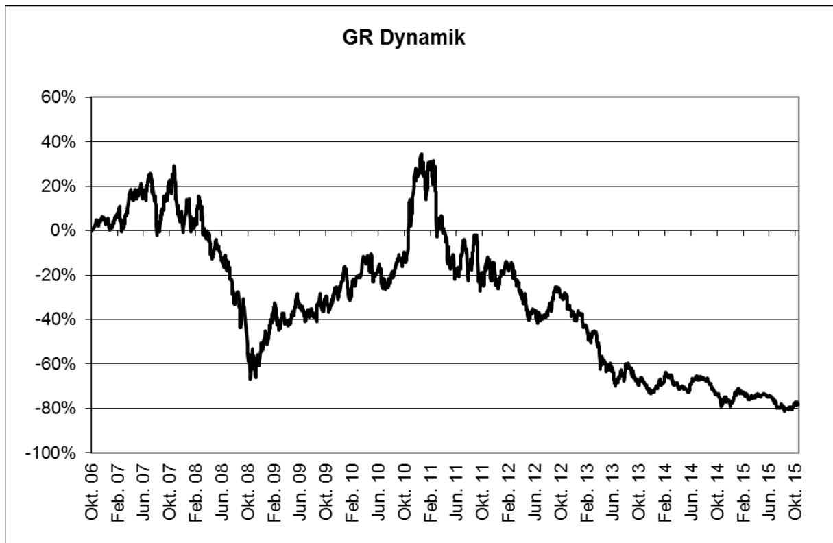
Abb. 2: Die Datenreihe zeigt die Wertentwicklung des GR Dynamik vom 16.10.2006 bis zum 31.10.2015. Die Wertentwicklung in der Vergangenheit ist kein Indikator für die zukünftige Wertentwicklung und keine Garantie für einen Erfolg in der Zukunft.