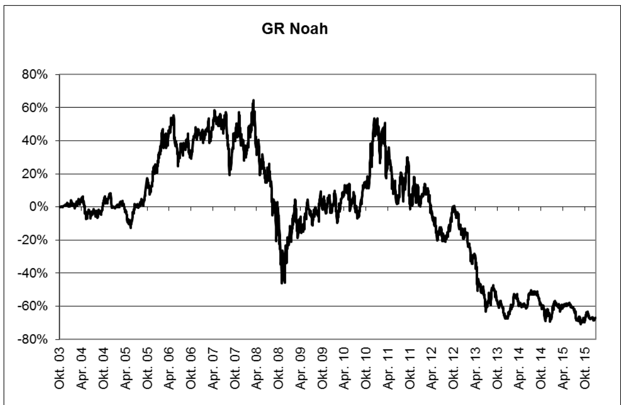
Abb. 2: Die Datenreihe zeigt die Wertentwicklung des GR Noah vom 01.10.2003 bis zum 31.12.2015. Die Wertentwicklung in der Vergangenheit ist kein Indikator für die zukünftige Wertentwicklung und keine Garantie für einen Erfolg in der Zukunft.