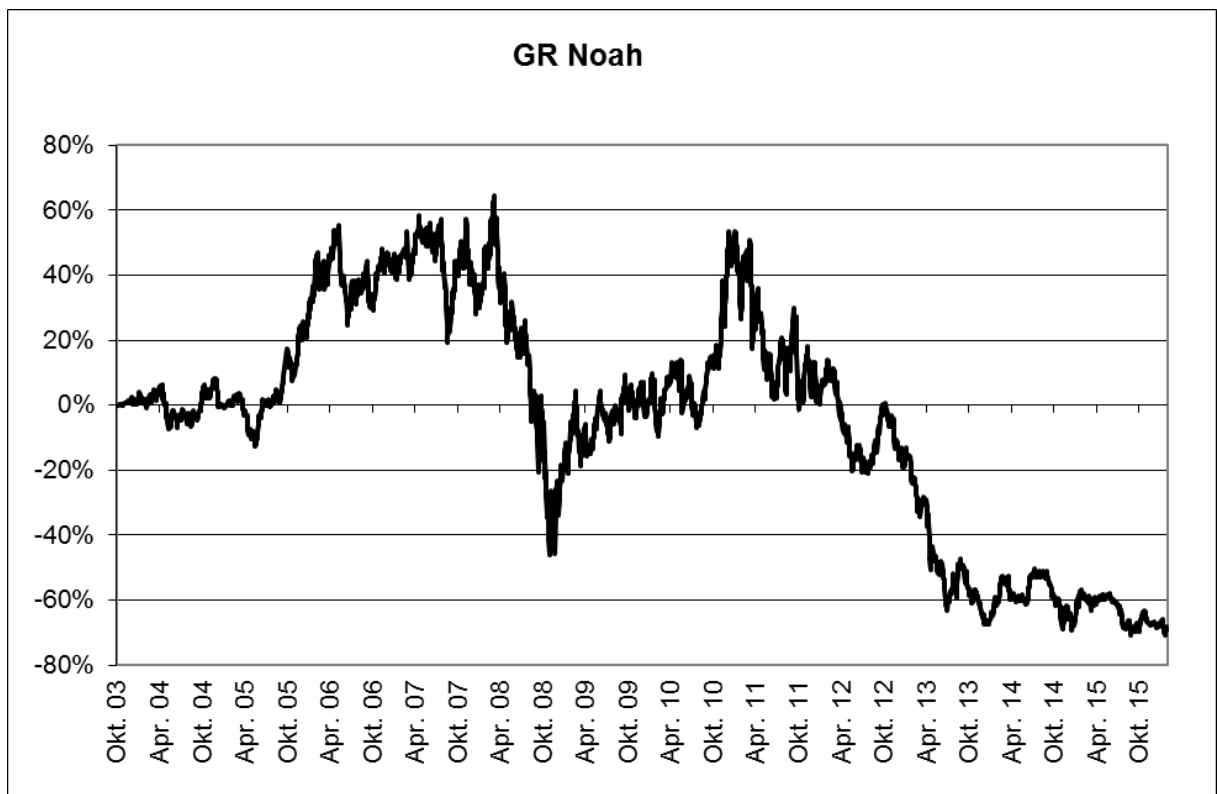
Abb. 2: Die Datenreihe zeigt die Wertentwicklung des GR Noah vom 01.10.2003 bis zum 31.01.2016. Die Wertentwicklung in der Vergangenheit ist kein Indikator für die zukünftige Wertentwicklung und keine Garantie für einen Erfolg in der Zukunft.